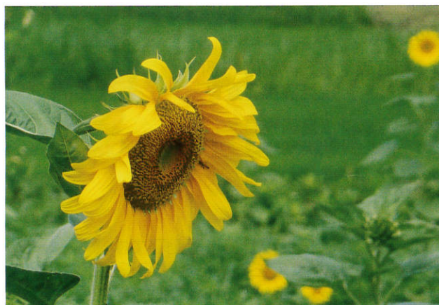
表紙写真 廿日市市吉和 ひまわり畑

初めての廿日市署勤務です。皆様方のお力添えをいただき、適正な滞納整理の推進に努めてまいりたいと思いますので、どうぞよろしく願いいたします。